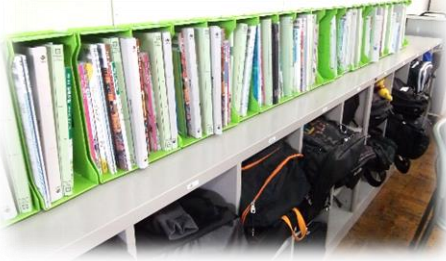
=五中では、家に持ち帰る教科書等は自分で考えます。「今日の家庭学習では...」 =

< お詫び > この度、当該のご家庭に提出いただきました、「自転車通学許可願ひ」の裏面地図が、校区全域を網羅しておりませんでした。欄外にご自宅をご記入されたり、困惑されたりした保護者の皆様には、大変失礼いたしました。 来年度に向けて、速やかに改善を図ります。 誠に申し訳ございませんでした。