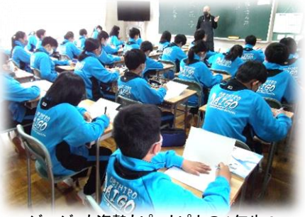
=ジャージも姿勢もピッカピカの1年生! =