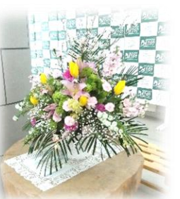
=入学式のお花は今もイキイキ! =

What's up? とは、英語の簡単なあいさつで、「元気?」「どうしてる?」にあたります。このコーナーでは、「五中生・五中のキラリ輝く今」を5つ星になぞらえ、5枚の写真でお伝えします! リクエストは、お気軽に ☎34-5710 にお寄せください。