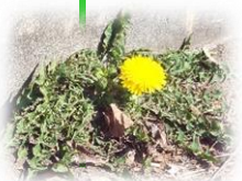
4/8 学級発表に見入る 子どもたちの足元に ひっそりと・・・

最後に、一編の詩をご紹介します。今の時代をどのように受け止め、感じているかは、お子様それぞれだと思いますが、かけがえのない存在には変わりありません。3年間という限られた時間の中で、一人一人の可能性を最大限に伸ばすのが、学校の役割です。お子様たちの未来を見据えながら、「今」を大切にしていきたいと思います。