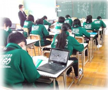
=美術の授業でもタブレットを使う時代...2年生=