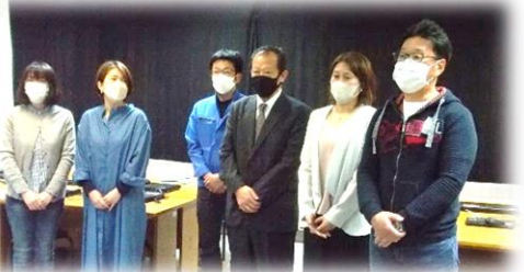
=新役員の皆様、よろしくお願ひいたします= (ご紹介は、総会資料に代えさせていただきます)