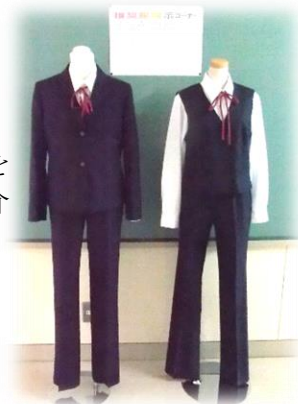
展示は12月2日(金)迄です

まず、既に、ご家庭にお知らせのとおり、「女子推奨服のスラックス」は、ご希望により、季節を問わずいつからでも着用いただくことができます。見本をご覧になりたい方は、2階・職員室前に展示しておりますので、お気軽にお越しください。なお、価格や納期等は、各販売店に直接お問い合わせ願います。