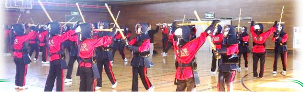
【授業の一コマ】感染症対策を講じながら武道を再開しています

前号に続き、裏面にアンケート結果②を掲載しましたので、ご覧ください。 また、生徒・保護者の皆様から寄せられたご意見をご紹介します。 全て、全教職員で拝読しておりますが、紙面の都合上、主なご意見を一部 抜粋で掲載させていただきますことをお許しください。